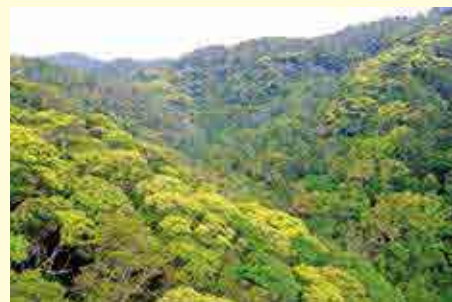
新緑が輝くやんばるの森

やんばるの森が最も輝き、命あふれる季節となりました。一見、1年中同じ緑に見える森。ですが、この季節になると、芽吹いたばかりのみずみずしい葉が明るく、一口に「みどり」と言っても色々な緑が目に入ります。おや?どうやらにおいも春の気配。やんばるの森からの春やうりずんの便り。みなさんにはどのような便りが届くでしょう。