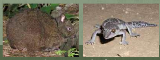
アマミノクロウサギ オビトカゲモドキ

徳之島は、北部の天城岳(533m)や中央部の井之川岳(645m)から犬田布岳(417m)にかけて広がる山塊が豊かな亜熱帯照葉樹林に覆われており、アマミノクロウサギをはじめ、オビトカゲモドキやトクノシマトゲネズミなどの遺存固有種の生息地となっています。