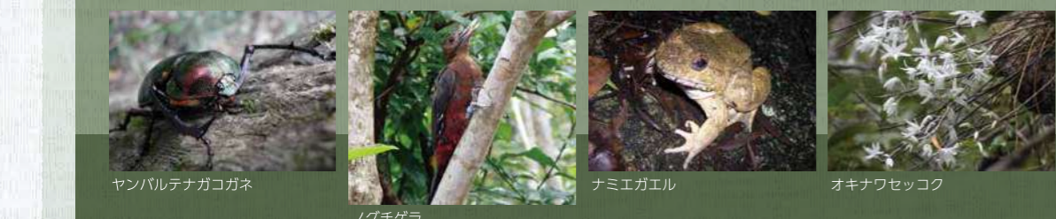
ヤンバルテナゴカガネ ノグチゲラ ナミエガエル オキナワセッコク