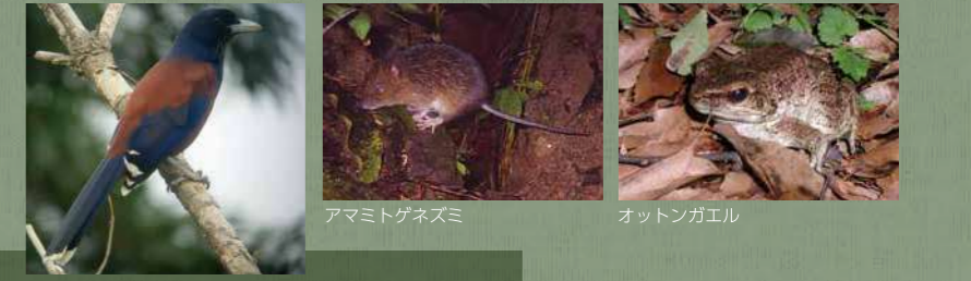
ルリカケス アマミトゲネズミ オットンガエル

奄美大島の中央部・南部では、湯湾岳(694m)や油井岳(484m)などの山塊から海域まで豊かな亜熱帯照葉樹林が連続しています。これらの森林では、アマミノクロウサギ、アマミトゲネズミ、ルリカケス、オットンガエルなどの遺存固有種やアマミヤマシギなどの希少種の生息地となっています。また、役勝川や河内川などの河川にはリュウキュウアユが生息しています。