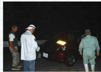
密猟・盗掘防止パトロール

出典「琉球の自然史」(1980, 築地書館(東京)) Geographic patterns of Endemism and Speciation in Amphibians and Reptiles of the Ryukyu Archipelago, Japan, with Special Reference to their Paleogeographical Implications (Res. Popul. Ecol. 40(2), 1998 pp. 189-204.)