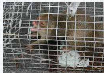
捕獲されたマンゴース

推薦地の顕著な普遍的価値を保全するため、関係行政機関や地域住民をはじめとする多様な主体が協働し、侵略的外来種の防除事業の実施、ネコ・イヌによる影響の排除・低減、希少種の違法採取や交通事故の防止、適切な観光管理の実現などに取り組んでいます。