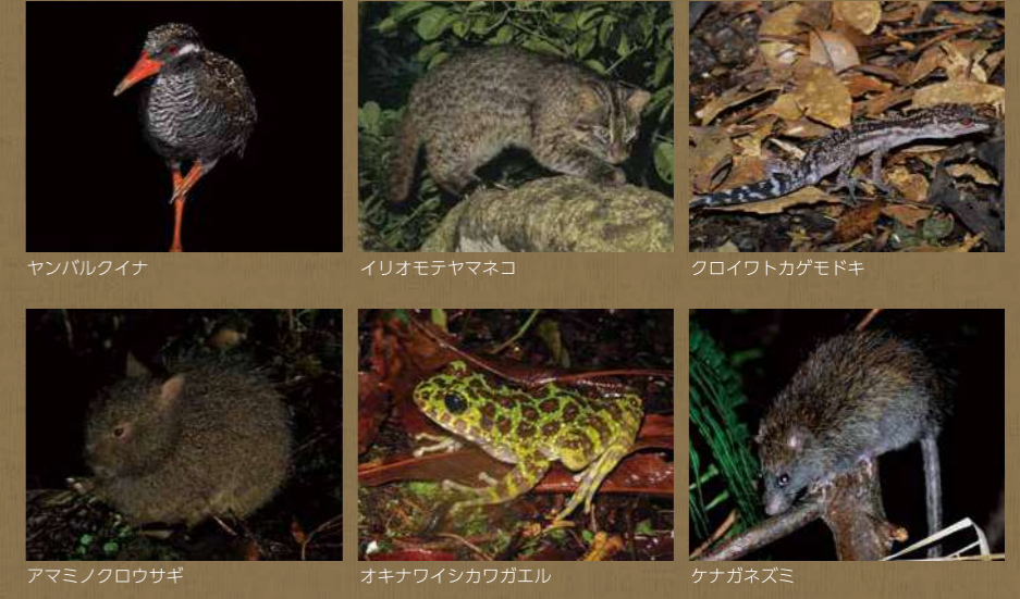
ヤンバルクイナ イリオモテヤマネコ クロイワトカゲモドキ アマミノクロウサギ オキナウイシカワガエル ケナガネズミ

本地域には、ここでしか見られない生物が数多く分布しています。特に、昔は広く大陸などにも分布していた生物が島々に隔離されたことで、大陸にいた共通の祖先が絶滅した後も昔ながらの形態をとどめながら生き残ってきた「遺存固有種」や、各々の島の環境に適応するよう独自の進化を遂げた「新固有種」の存在は、地史を反映した生物進化の過程を示す顕著な見本となっています。