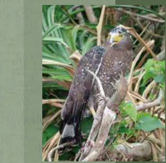
イリオモテヤマネコ ヤエヤマセマルハコガメ カムリワシ

西表島には、古見岳(469m)や御座岳(420m)などの山々が連なり、原生状態に近い亜熱帯照葉樹林やマングローブ林、我が国最大規模のサンゴ礁(石西礁湖)を有するなど、手つかずの自然が残されています。山地は雲霧帯を有するため、ランやシダなどの着生植物が多く、イリオモテヤマネコ、ヤエヤマセマルハコガメなどの八重山固有の生物が生息しています。