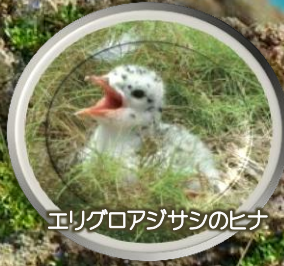
エリグロアジサシのヒナ